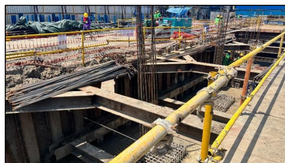
รูปที่ 1-3 สภาพโครงการปัจจุบัน